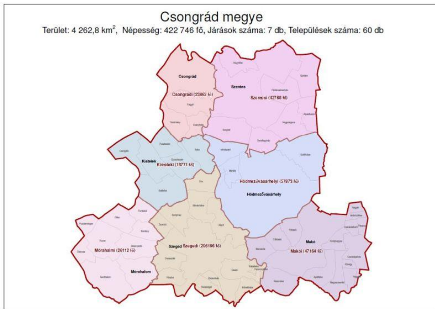
3. ábra Járások és települések határai Csongrád megyében

A járások létrejöttével az érdekeltségi területek az alábbiak szerint módosulnak: