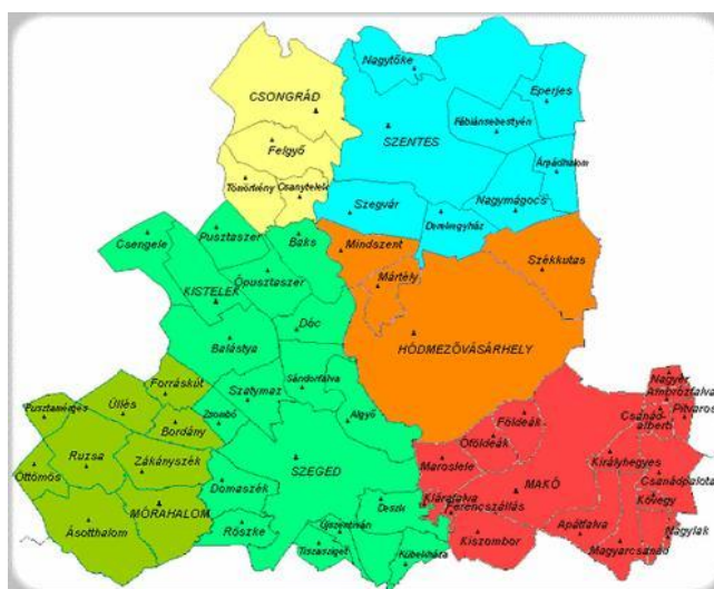
2. ábra A CSMKH Földhivatalának működési területe

A Csongrád Megyei Kormányhivatal Földhivatala alá 6 körzeti földhivatal tartozik csongrádi, hódmezővásárhelyi, makói, mórhalmi, szegedi és szentesi székhellyel.